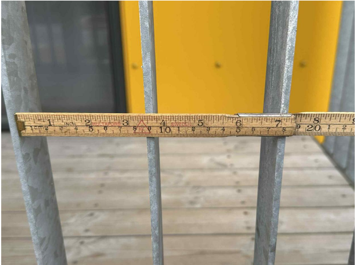
Mynd 1. Ljósmynd af tommustokk við svalahandrið í Hallgerðargötu á Kirkjusandi.

Þau flatjárnshandrið sem hér eru til umræðu eru lýðheilsuvá. Þegar þau flauta í vindi trufla þau íbúa og svefn þeirra. Það verður því að fara varlega þegar flatjárnshandrið eru notuð og ráðast í mótvægisáðgerðir strax til þess að koma í veg fyrir „draugaflautið“. Hreinir tónar í truflandi hljóði eru sérstaklega óþægilegir. Þá liggur eigintónninn mjög hátt í tónsviðinu; þar sem eyrað er hvað næmast (sjá mynd af jafnstyrkleikakúrfum heyrnarinnar). Tónhæðin er nærri tíðni í ung barnagráti og því sérstaklega truflandi.